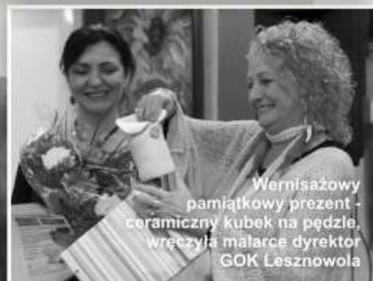
Wernisażowy pamiątkowy prezent - ceramiczny kubek na pędzle, wręczyła malarka dyrektor GOK Lesznówola