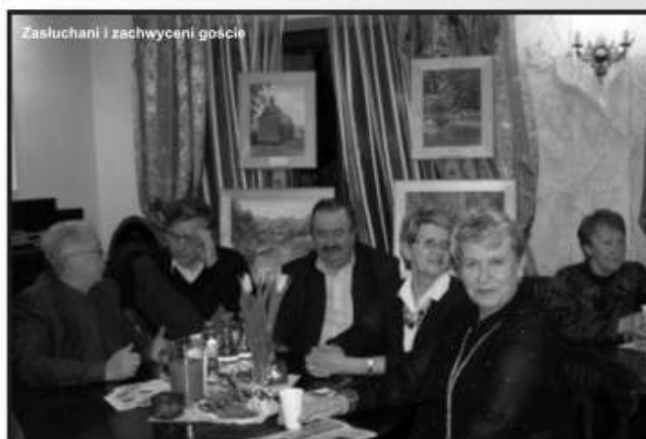
Zasłuchani i zachwyceni goście

Nasz gość opowiadał o historii swojej kariery zawodowej oraz o swoich przeżyciach związanych z licznymi koncertami na największych światowych scenach. Ma na koncie między innymi występy w wielu teatrach operowych Europy i Stanów Zjednoczonych oraz udziały w licznych festiwalach. Jej ostatnim sukcesem był debiut na deskach Royal Opera House w Londynie, gdzie wcieliła się w rolę Azuceny z opery Trubadur Verdięgo. W zestawieniu amerykańskiego tygodnika Time w 1999 roku została zaliczona do grona dziesięciu najslawniejszych Polaków jako „jedna z gwiazd, które oświetliły Polskę drogę w następnym tysiąclecie”. W konkursie Perły Polskiej Gospodarki 2008 r. została uhonorowana Perłą Honorową za krzewienie kultury polskiej na świecie.