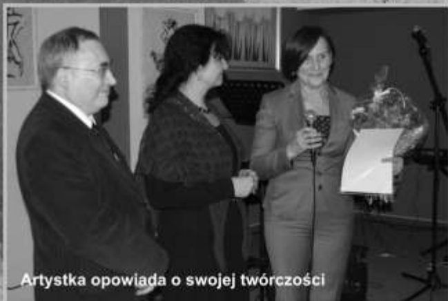
Artystka opowiada o swojej twórczości